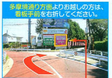
南多摩斎場 南多摩斎場看板が目印です。