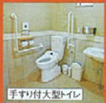
手すり付大型トイレ