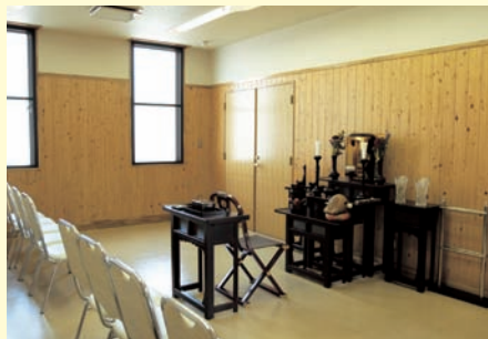
60名様収容できる礼拝堂