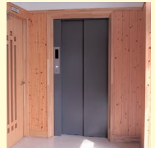
エレベーターを設け、安心の管理