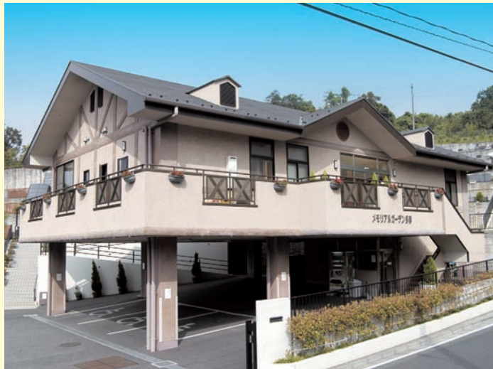
近代的なつくりの管理棟