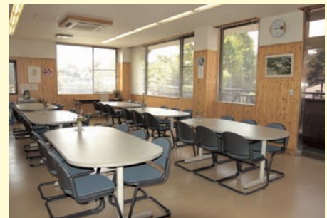
ゆったりと落ち着ける休憩所