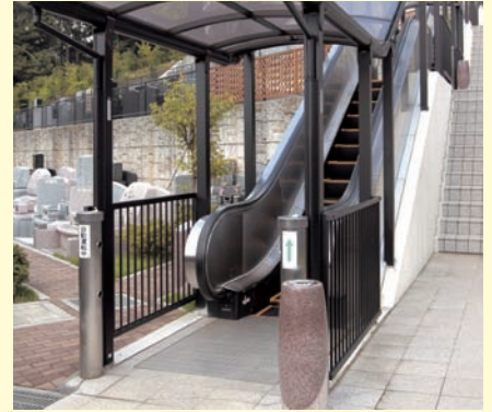
エスカレーターをご用意しています。