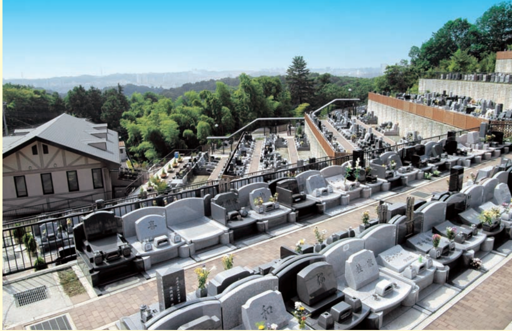
メモリアルガーデン墓域