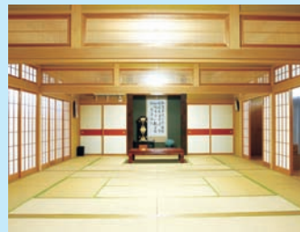
広々とした客殿和室