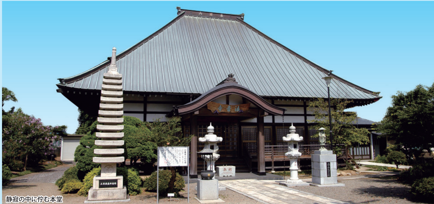
静寂の中に佇む本堂