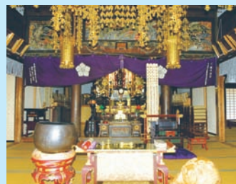
古刹の歴史ある内陣