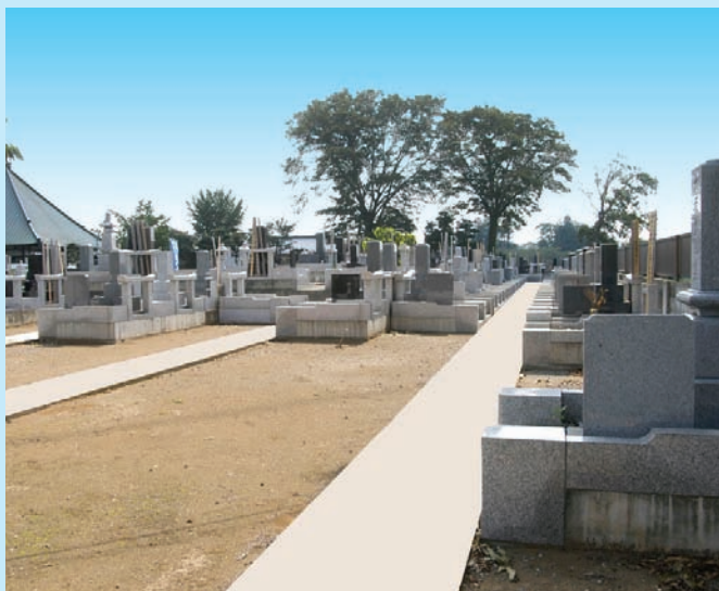
木々の緑が美しい墓地

圏央道坂戸インターからお車で約3分、東武東上線若葉駅よりお車で約10分と大変便利な立地です。