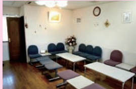
常駐のスタッフが皆様の大切なお墓を管理します。