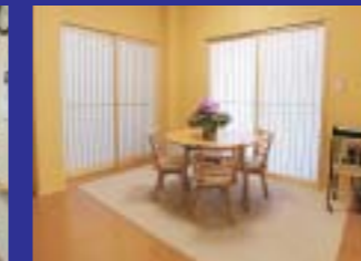
ちょっとした緊張の息抜きに休憩所をご利用ください。