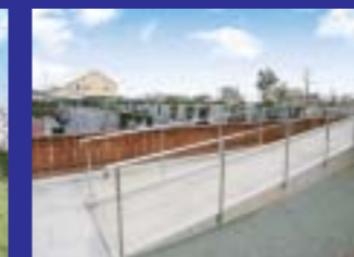
車椅子の方にやさしい、数多くあるスロープ