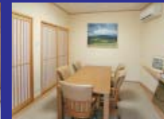
待ち合わせにもご利用できる打合せ室