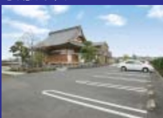
本堂から近い駐車場