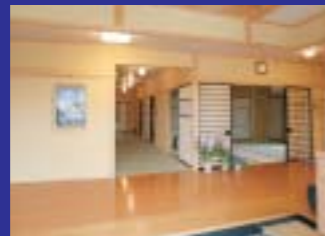
皆様を気持ち良く迎える広々とした本堂客殿入口