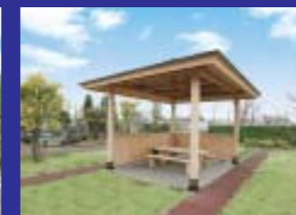
ちょっと一服、腰を休める「あずまや」