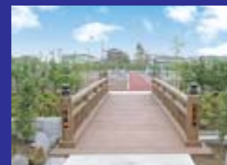
苑内を流れる小川を渡る朋友橋