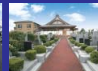
本堂左側に位置するA区画は大変好評です。