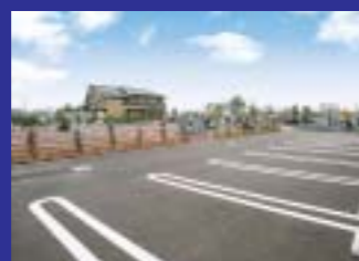
墓域から近い第四駐車場