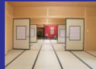
ゆったりと故人を偲ぶにふさわしい法要室