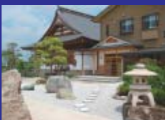
本堂を見渡せる庭園が心、癒します。